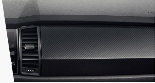
Instrumententafel in Carbon-Optik