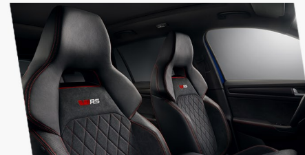
Alcantara-Sportsitze mit roten RS-spezifischen Kontrastnähten im Diamond-Cross-Design und dem neuen vRS-Logo