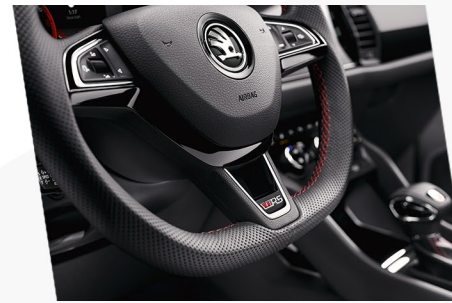
Sport-Lederlenkrad mit Multifunktion, vRS-Logo und den roten Kontrastnähten auf den Armlehnen in den Türen

Interieur: Sportliches Cockpit mit optischen Highlights