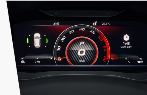
Virtual Cockpit mit neuem Hintergrund im sportlichen Carbon-Look