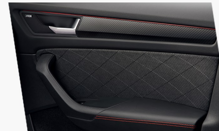
Türverkleidungen mit schwarzer Kontrastnaht im Diamond Cross Muster und roten Kontrastnähten auf den Armlehnen in den Türen