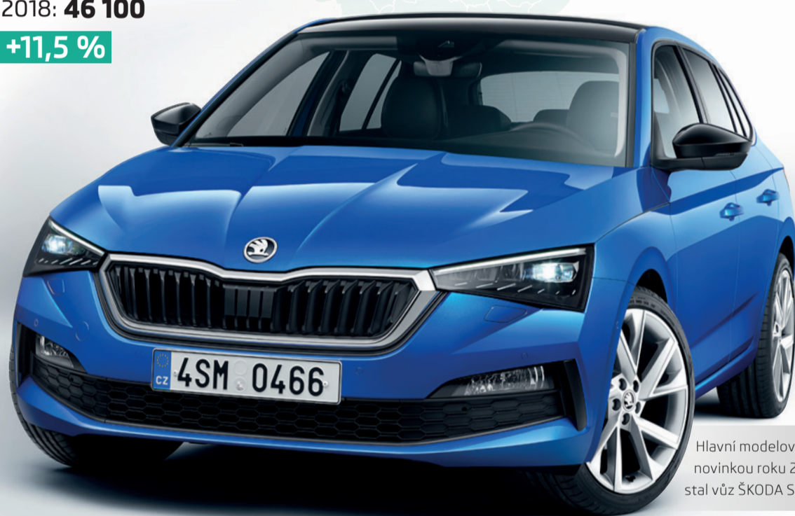
Hlavní modelovou novinkou roku 2018 se stal vůz ŠKODA SCALA.