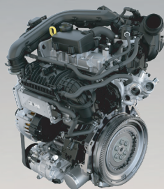
1,0 TSI 81 kW