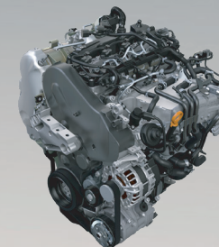
2,0 TDI 85/110 kW